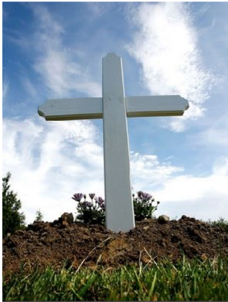
Algjört úrræðaleysi er sagt ríkja í málefnum ungra fíkla