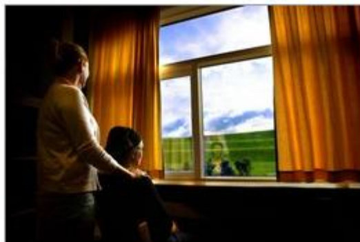
Tíu prósent íslenskra barna eru á einhvers konar geðlyfjum að sögn Önnu.

„Yfirleitt er rótin að vandanum einhver erfið reynsla og þá er mælt með sálfræðimeðferð. Á sama tíma er mjög lélegt aðgengi að sálfræðingum, bæði í gegnum skólana og heilsugæsluna. Þeir foreldrar sem hafa ráð á því leita þannig með börnin sín á einkastofur sálfræðinga og borgar 13 til 15 þúsund krónur fyrir tímann þar. Það hafa auðvitað ekki allir efni á þeirri þjónustu og þá spyr maður sig hvort það geti aukið hættuna á að börnum séu gefin geðlyf.“