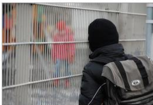
120 börn eru á biðlista til að komast inn á BUGL.