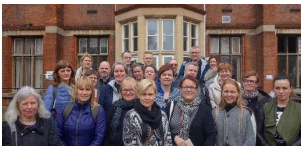
24 fulltrúar frá Geðhjálp, öðrum félagasamtökunum, stofnunum og sveitarfélögum kynntu sér starfsemi bataskóla í Bretlandi.

Geðhjálp heldur utan um reglulega fundi samráðsvettvangs fulltrúa frjálsra félagasamtaka og athvarfa á höfuðborgarsvæðinu. Samráðsvettvangurinn stóð fyrir kynnisferð í tvo bataskóla (Recovery College) í London og Nottingham um mánaðamótin mars og apríl. Þátttakendur í ferðinni voru fulltrúar frjálsra félagasamtaka, stofnana og sveitarfélaga um landið allt. Eftir ferðina voru ferðalangarnir sammála um að fullt tilefni væri til að stofna bataskóla á Íslandi. Geðhjálp náði samstarfi við Reykjavíkurborg um stofnun skólans og hefur sveitarfélagið heitið því að verja 15 mkr. árlega í þrjú ár til rekstar skólans. Virk veitti Geðhjálp 4,2 mkr. styrk til að kosta ferð 15 manna hóps í work shop til Nottingham í febrúar árið 2017. Stefnt er að því að hefja formlegt skólastarf í skólanum haustið 2017.