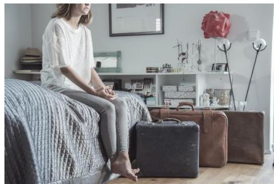
Í Útmeð'a verkefni Geðhjálpar og Hjálparsímans var lögð áhersla á sjálfsskaða ungs fólks með áherslu á ungar konur

Hápunktur Útmeð'a verkefnisins fólst í frumsýningu stuttmyndar og vefs forvarnarverkefnisins í tengslum við Alþjóðlegan forvarnardag sjálfsvíga þann 10. september. Í stuttmyndinni er sjónum fólks sérstaklega beint að sjálfsskaða meðal stúlkna. Á vefnum www.utmeda.is er hægt að nálgast aðgengilegar upplýsingar um sjálfsskaða/sjálfsvígshugsanir frá sjónarhóli fólks með vanlíðan og nákominna ásamt því að fjallað er almennt um vandann. Átakið vakti talsverða athygli í fjölmiðlum og meðal ungs fólks. Myndband Útmeð'a um sjálfsskaða hefur hlotið tilnefningu til Íslensku auglýsingaverðlaunanna í flokki rafrænna auglýsinga fyrir árið 2016. Verkefninu verður haldið áfram með fræðslu til framhaldsskólakennara á landsbyggðinni á fyrrihluta ársins 2017.